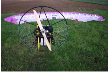
Le Miniplane en question....